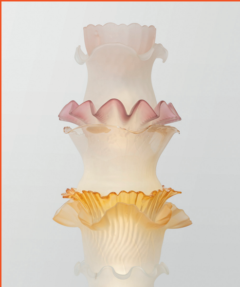
Éléonore False. Détail Tulipe #2, 2024 , série Tulipes . ADAGP, Paris, 2025. Production Frac Sud – Cité de l'art contemporain, Marseille.

GRAND ARLES EXPRESS 2025 LE FIL DE CHAÎNE